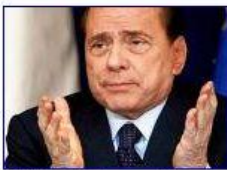
Silvio Berlusconi den 1024 x 768 - 93kb - jpg badische-zeitung.de

På 1. siden i søgeresultatet vælger du fx. dette billede, hvor Berlusconi har en lidt undskyldende attitude. Samtidig har billedet en god størrelse på 1024x763 pixels. Det passer godt i vores 4:3 format (440x330 pixels)